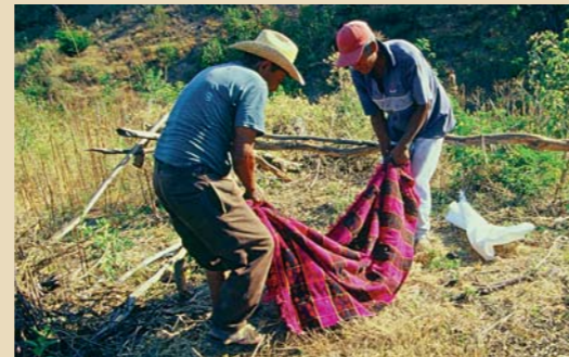
DIE SAMEN WERDEN GESAMMELT...