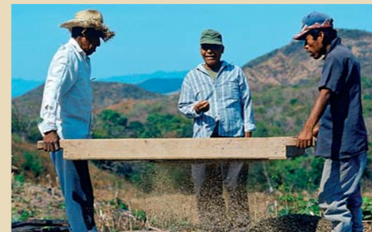
...UND MIT EINEM SIEB GEREINIGT.