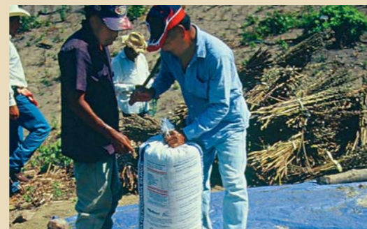
IN SÄCKEN WIRD DIE ERNTE ABTRANSPORTIERT.