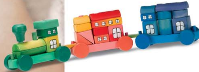
Jouets illustrés : livipur

Composition : glycérine, eau, acide silicique, alginate, extraits de fleurs de souci (calendula), huile de fenouil, huile essentielle de menthe verte, esculine.