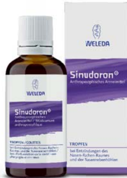
Sinudoron® Tropfen Unterstützen das Abschwellen der Schleimhäute bei Sinusitis

Weleda Schnupfcreme lässt Nasenschleimhäute bei verstopfter Nase abschwellen, vermindert den Nasenfluss und löst Krusten bei trockenem Schnupfen.