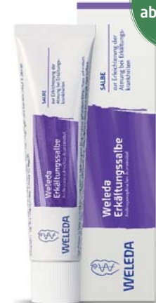
Weleda Erkältungssalbe Wärmend, schleimlösend und schleimhautabschwellend

Rhinodoron® mit Aloe vera unterstützt die Regeneration der Nasenschleimhaut bei (Heu-)Schnupfen und eignet sich in der Schwangerschaft, Stillzeit und für Säuglinge.