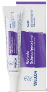
Weleda Schnupfcreme Abschwellend und krustenlösend

Weleda Schnupfcreme lässt Nasenschleimhäute bei verstopfter Nase abschwellen, vermindert den Nasenfluss und löst Krusten bei trockenem Schnupfen.