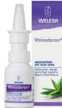
Rhinodoron® Nasenspray mit Aloe vera* Befeuchtet und pflegt trockene Nasenschleimhaut

Sinudoron® hilft bei akuten und chronischen, eitrigen und fieberhaften Entzündungen der Schleimhäute des Nasen-Rachen-Raumes und der Nasennebenhöhlen.